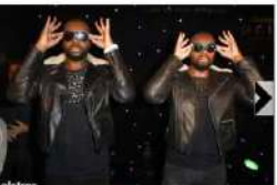
Maître Gims entre au musée Grévin