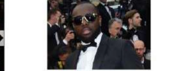
Maître Gims, sapé pour toujours

Maître Gims, qui avait battu tous les records de ventes de disques, a dévoilé sa statue de cire au musée Grévin. Le Parisien, qui dévoile l'information, annonce que la statue sera dévoilée le 2 octobre prochain dans le cadre d'une soirée spéciale.