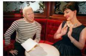
Le moment où Jean Paul Gaultier se voit de l'extérieur, en 2011, en musée Grévin

PEOPLE CULTUREL Le musée Grévin propose un «lifting» à Jean Paul Gaultier.