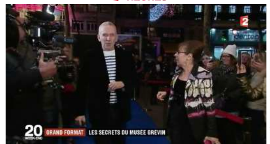
20 GRAND FORMAT LES SECRETS DU MUSÉE GREVIN

Jean Paul Gaultier Entre Une Seconde Fois Au Musée Grévin