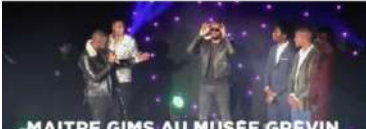
MAÎTRE GIMS AU MUSÉE GRÉVIN

CHANSON - Dans une soirée en grande pompe, l'ancien membre phare du groupe de rap français Sexion d'Assaut rejoint le "panthéon" en cire des stars.