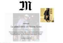
Maître Gims fait son entrée au Musée Grévin ! (vidéo)

Maître Gims a dévoilé sa statue de cire au musée Grévin... les internautes se précipitent à lui taper