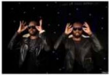
Maître Gims a sa statue au Musée Grévin