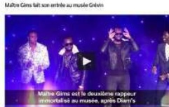
Maître Gims est le deuxième rappeur immortalisé au musée, après Diam's