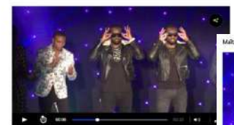
La statue de cire de Maître Gims rejoint dans le célèbre musée parisien d'autres chanteurs et artistes.

Lundi, le chanteur Maître Gims a fait son entrée au musée Grévin, dans le 9 ème arrondissement de Paris. Son hommage de cire, vêtu de noir et orné de ses fameuses lunettes de soleil que le rappeur porte souvent, y rejoint celles d'autres artistes comme Madonna ou M Pokora.