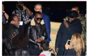
Lundi soir, Maître Gims a officiellement fait son entrée au musée Grévin