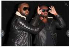
Maître Gims a dévoilé sa statue de cire au musée Grévin... les internautes se précipitent à lui taper