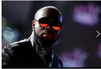
Maître Gims : bientôt sa statue de cire au musée Grévin