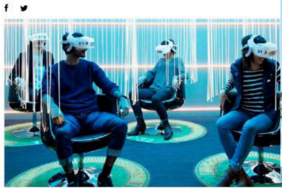
Flyview propose un voyage en réalité virtuelle et réalité augmentée au cœur des pyramides d'Égypte.

Par Chloé Ronchin - Mis à jour le 09/06/2021 à 22:26 Publié le 09/06/2021 à 22:26